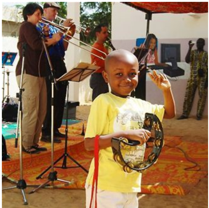
Ceòl ann an Chad