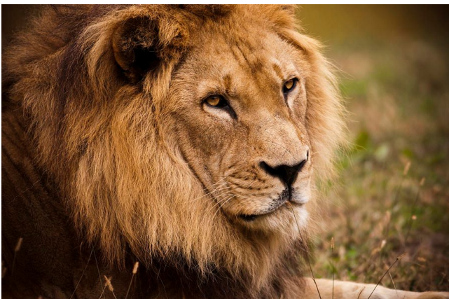
Leòmhann ann an Chad

Tha tòrr beathaicheann ann an Chad. Chì thu aibhein, sròn-adharcaich agus leòmhainn gu tric.